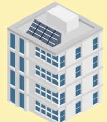
後期高齢者医療広域連合