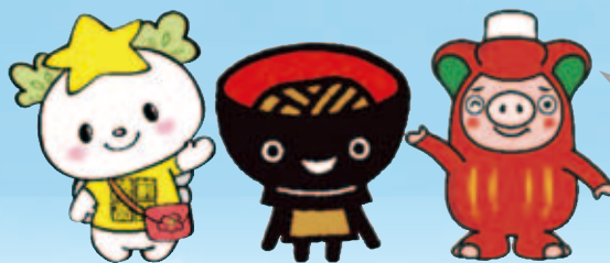
たかたのゆめちゃん ②わんこきょうだい そぼっち おおふなトン