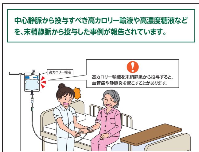
No.209 中心静脈から投与すべき輸液の末梢静脈からの投与